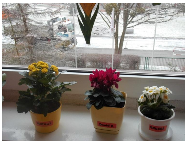
Tam zima , a u Nas wiosna.

Na przełomie października i listopada odbył się w naszym przedszkolu konkurs plastyczny między grupami przedszkolnymi ( udział wzięło 8 grup wiekowych).