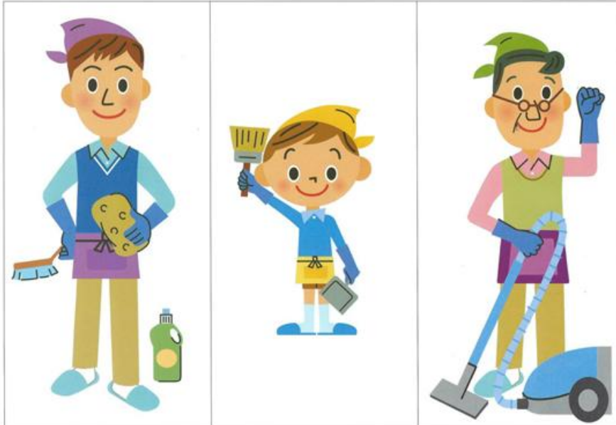
Projekt dydaktyczny stanowi integralną część materiału zajęć z numeru 3.222 z marca 2021 miesięcznika B.ZiU/PRZEDSZKOLA – materiały na kartonik. Rozpisanie i zdanie chronione są prawami autorskimi – kopiowanie, odtwarzanie, dystrybucja w internecie lub wykorzystywanie w innych celach niż przewidziane jest niedozwolone.