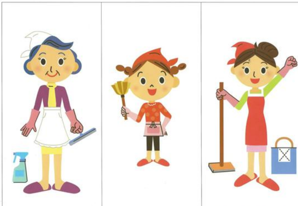
Projekt dydaktyczny stanowi integralną część materiału zajęć z numeru 3.222 z marca 2021 miesięcznika B.ZiU/PRZEDSZKOLA – materiały na kartonik. Rozpisanie i zdanie chronione są prawami autorskimi – kopiowanie, odtwarzanie, dystrybucja w internecie lub wykorzystywanie w innych celach niż przewidziane jest niedozwolone.